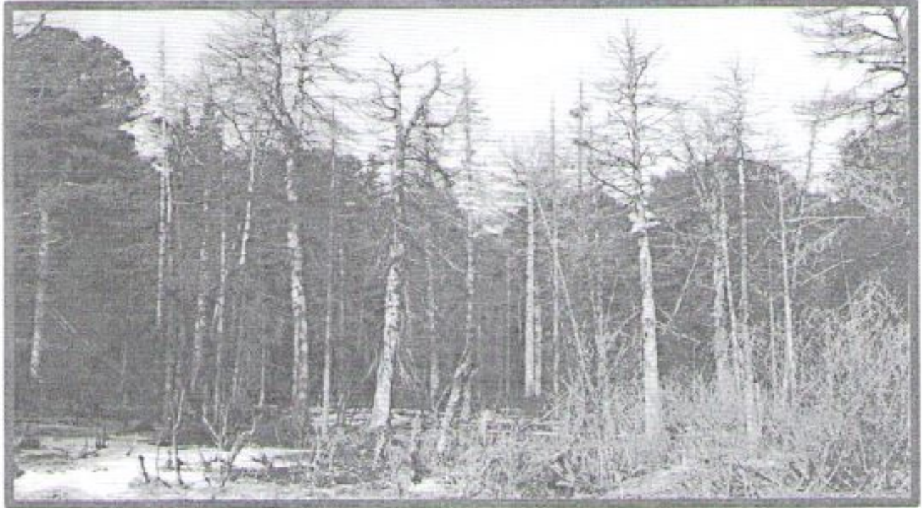
Изображение № 4 Сухостойное дерево. Не является валежником Изображение № 5

Кроме того, необходимо обратить внимание, что деревья, которые лежат на земле, но не имеют признаков естественного отмирания (имеют зеленую листву или хвою), определять как «мертвые» не допускается (смотри изображение № 5).