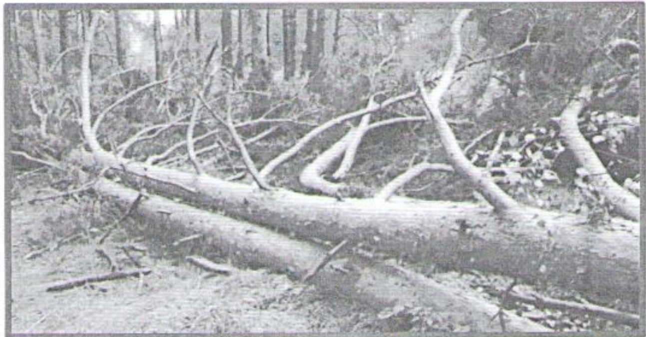
Лежащее на поверхности земли ветровалное дерево, не имеющее признаков отмирания. Не является валежником

Кроме того, необходимо обратить внимание, что деревья, которые лежат на земле, но не имеют признаков естественного отмирания (имеют зеленую листву или хвою), определять как «мертвые» не допускается (смотри изображение № 5).